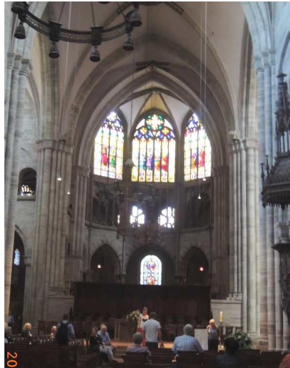
Det vackra kyrkorummet i Basels