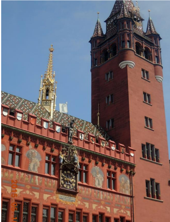
Basels rikt dekorerade stadshus Münster

Basels stadskärna är gammal, med mycket vackra byggnader med ornament, skulpturer och förgyllningar från medeltiden och renässansen. Den stora domkyrkan (kallas Münster på tyska) är ursprungligen från 1100-talet men är senare ombyggd i flera omgångar, senast i gotisk stil. Här kunde vi som avslutning på besöket njuta av orgelmusik i det vackra kyrkorummet.