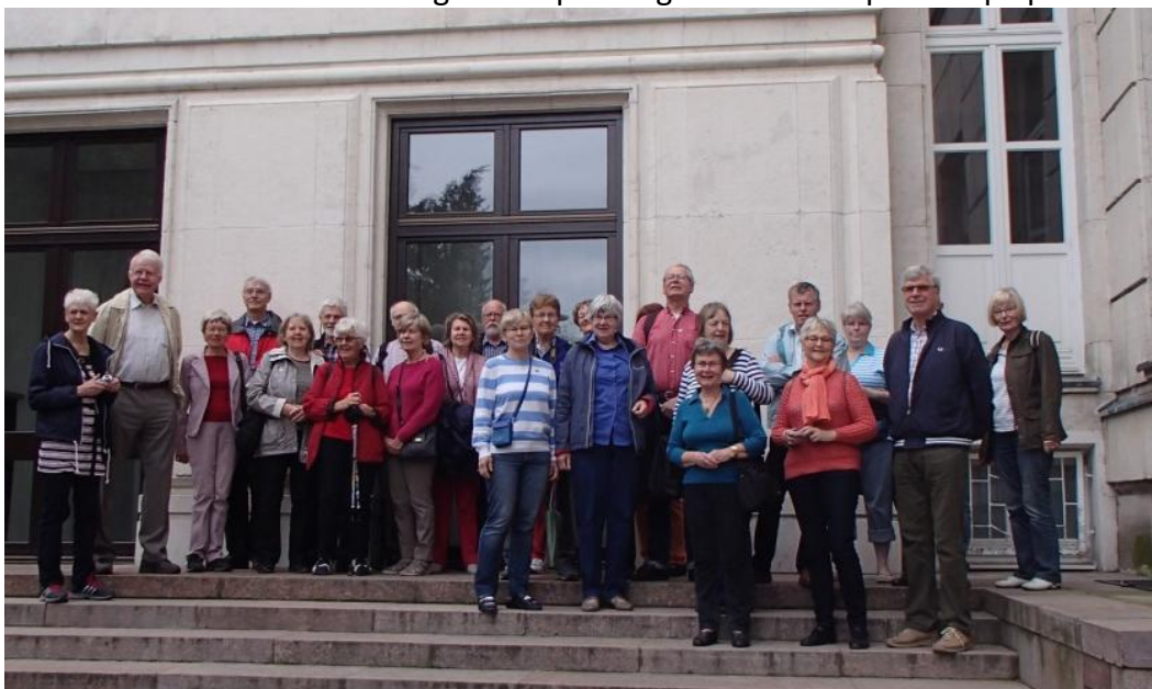
Europaklubsresenärerna vid sejmen

Vidare gick färden med tåg till Kraków som inte bombades under kriget, så mycket av den gamla bebyggelsen är bevarad. Den stora sevärheten där är Wavelkullen med gamla slottet och domkyrkan där Sigismund III är begravd. I Kraków verkade Oscar Schindler som genom list lyckades rädda ett stort antal judar undan förintelsen under den tyska ockupationen genom att anställa dem i sin fabrik, där numera ett museum om judarnas liv i ghattot är inrymt. Händelserna är världsbekanta genom Spielbergs film som inspelades på plats.